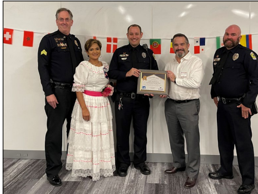
Premio Amigos de KEAFCS 2021-WPD

Patrocinadores, Voluntarios y Contacto Local