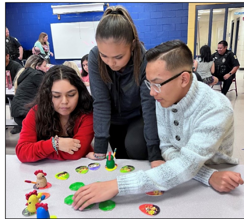
Distrito Escolar de Wichita